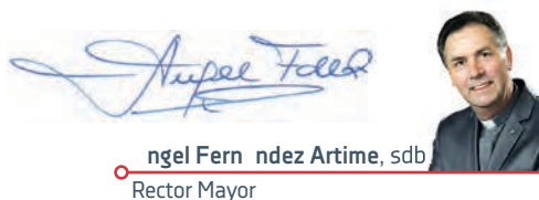
Ángel Fernández Artime, sdb Rector Mayor

Seguid bien y que el buen Dios os llene de su paz.