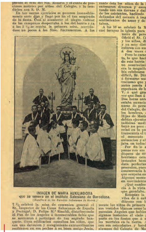
Boletín Salesiano de agosto de 1891 (p. 216).

Puedes consultar el blog personal sobre la historia del Boletín Salesiano: https://boletinsalesianos.blogspot.com/