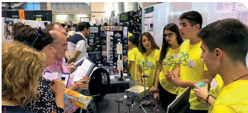
El equipo de Salesianos Úbeda presentando su proyecto: Adopta una estrella, investiga en astrofísica.

Como botones de muestra, en los últimos meses del curso: Salesianos Avilés obtuvo el primer premio del concurso nacional Desafío STEAM organizado por la Fundación Telefónica en torno a propuestas bajo el lema “Desafío al virus con STEAM”, con su riñonera inteligente “CSSA Wearable”. Salesianos Úbeda con el proyecto