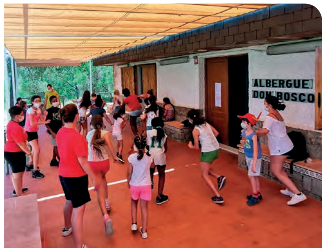
Juegos en el campamento del Centro de D a del Centro Juvenil Entre Amics de Valencia.

Este año alrededor de 10.000 niños, niñas, adolescentes y jóvenes se sumaron a las actividades del verano en positivo de los salesianos en España. Unas iniciativas que fueron posibles gracias a la colaboración de 1500 voluntarios que ofrecieron su tiempo libre para estar al servicio de los demás, entre animadores, educadores y salesianos.