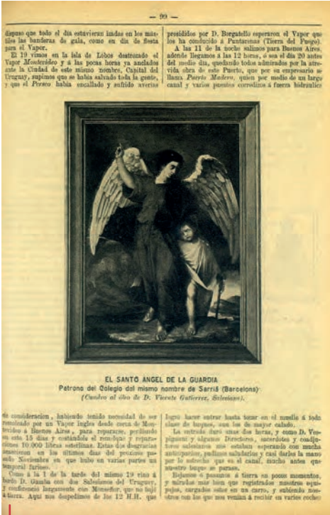
Boletín Salesiano de abril de 1891 (p. 99).