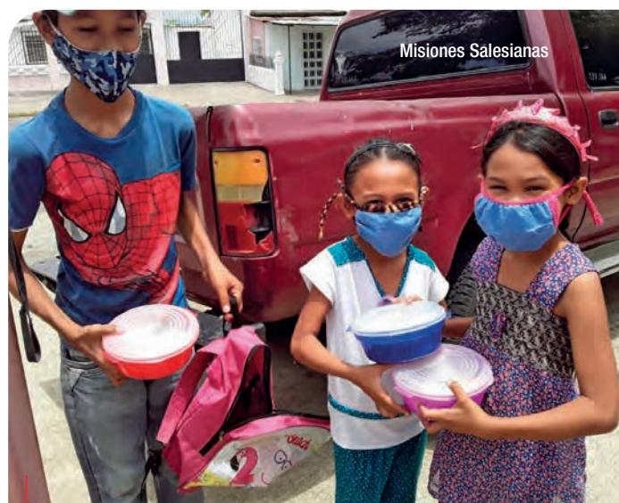
Beneficiarios de la Red de Casas Don Bosco con su comida.

El incremento de los precios y las largas colas que hay que hacer para conseguir algo de comida, combustible o medicinas son continuos, por lo que los menores se convierten en la población más vulnera-