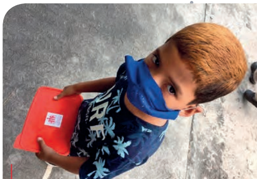
Reparto de la comida en uno de los centros de la Red de Casas Don Bosco en Caracas.

A pesar de las dificultades, y como haría Don Bosco, los misioneros salesianos continúan ayudando e infundiendo esperanza a la población, especialmente a los niños, niñas, adolescentes y jóvenes más necesitados incluso en las condiciones más adversas como las actuales de Venezuela.