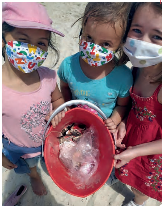
Los niños del campamento del Centro Juvenil Abertal de Vigo recogieron desperdicios en las playas cercanas.

“Todo el equipo de monitores creemos que es un momento imprescindible para ofrecerles esta alternativa de ocio a los chavales, ya que el curso acabó de esa manera tan rara para ellos. Para su propia salud era imprescindible volver a verse con sus amigos y empezar a tomar partida en esta nueva normalidad”, explica. Además, afirmó que tuvieron presente el momento en que Don Bosco, en plena epidemia del cólera, acompañó a sus jóvenes a pesar de saber que podían infectarse. “Siguiendo su ejemplo, creímos que teníamos que ofrecer actividades a los niños, cuidando todas las medidas de seguridad, para que este siguiera siendo un verano salesiano”.