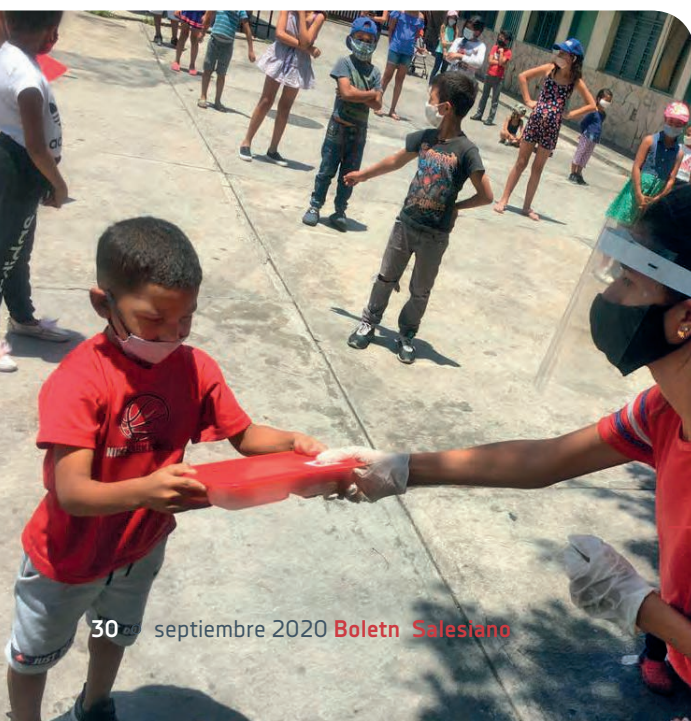
Entrega de la bandeja de comida a un niño en uno de los centros de la Red de Casas Don Bosco en Venezuela.

La Asociación Civil Red de Casas Don Bosco ofrece a diario en sus siete centros más de 700 desayunos y co-