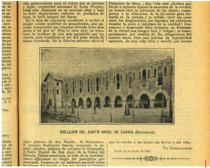
Boletín Salesiano de abril de 1891 (pg. 103).