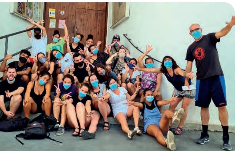
Jóvenes de la Plataforma Social Cruilla en Barcelona disfrutando del verano salesiano.