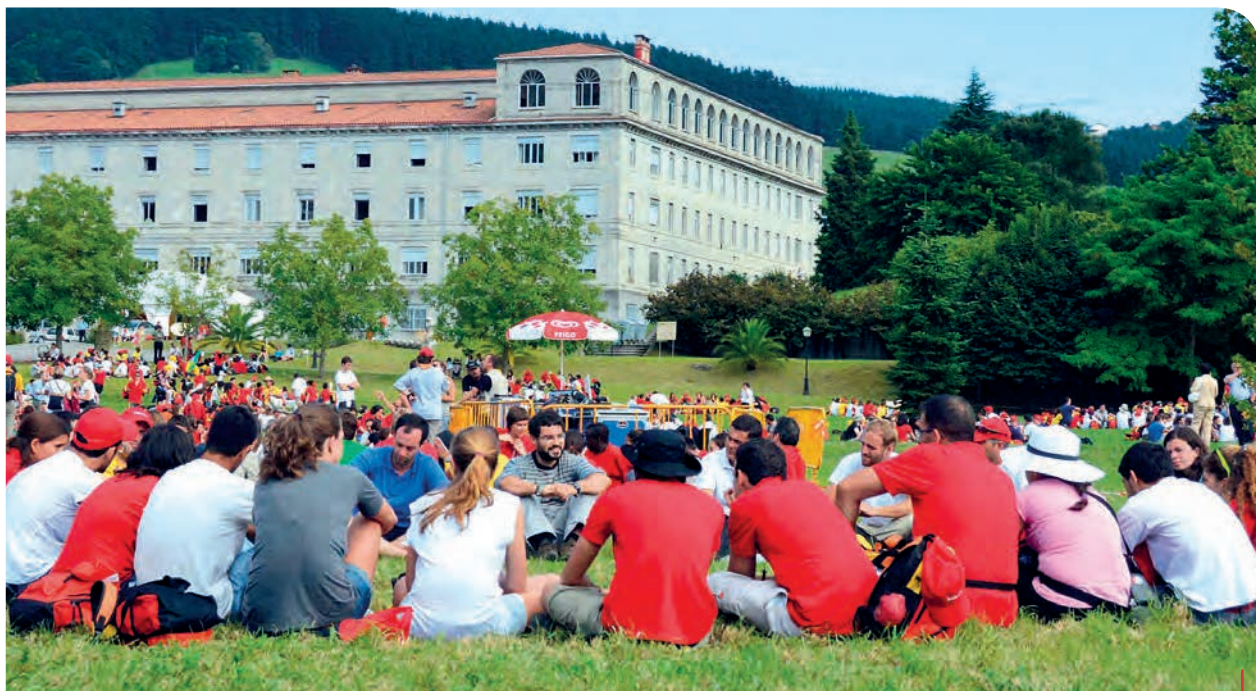
Una actividad de jesuitas. La imagen no se ha repetido este verano. (Imagen de archivo)