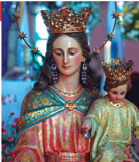
Imagen de María Auxiliadora en Salesianos Lora Tamayo de Jerez de la Frontera.