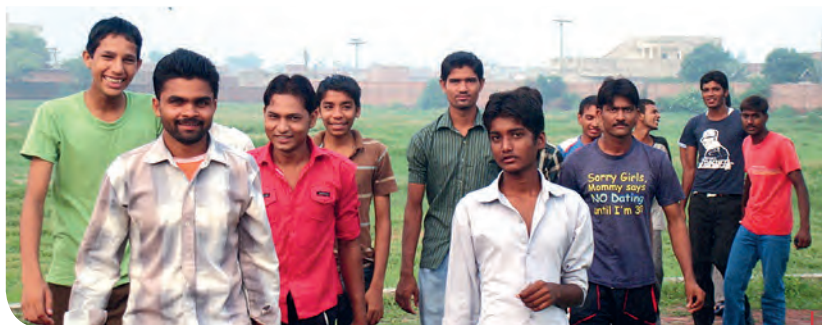
Alumnos del Centro Don Bosco de Lahore.

Pero siguen, más viejos, humanos, libres. Comparten vida con los jóvenes en Escuelas, Centros de Tiempo Libre o Casas de acogida, están con los inmigrantes y refugiados en playas y refugios, con mujeres maltratadas, con chavales crucificados por la droga, con locos, enfermos, solos... los últimos. Están en aulas, Monasterios, parroquias, editoriales, Hospitales, calles. Algunos dicen que están pasados de moda, pero ellos y ellas siguen, convencidos de que la fuerza del Resucitado puede transformar la Historia. El 2 de febrero la Iglesia les recuerda. Gracias por la generosidad de estas gentes de Dios que creen que la utopía de un mundo más humano no es un sueño inalcanzable. Ellos ya la están saboreando.