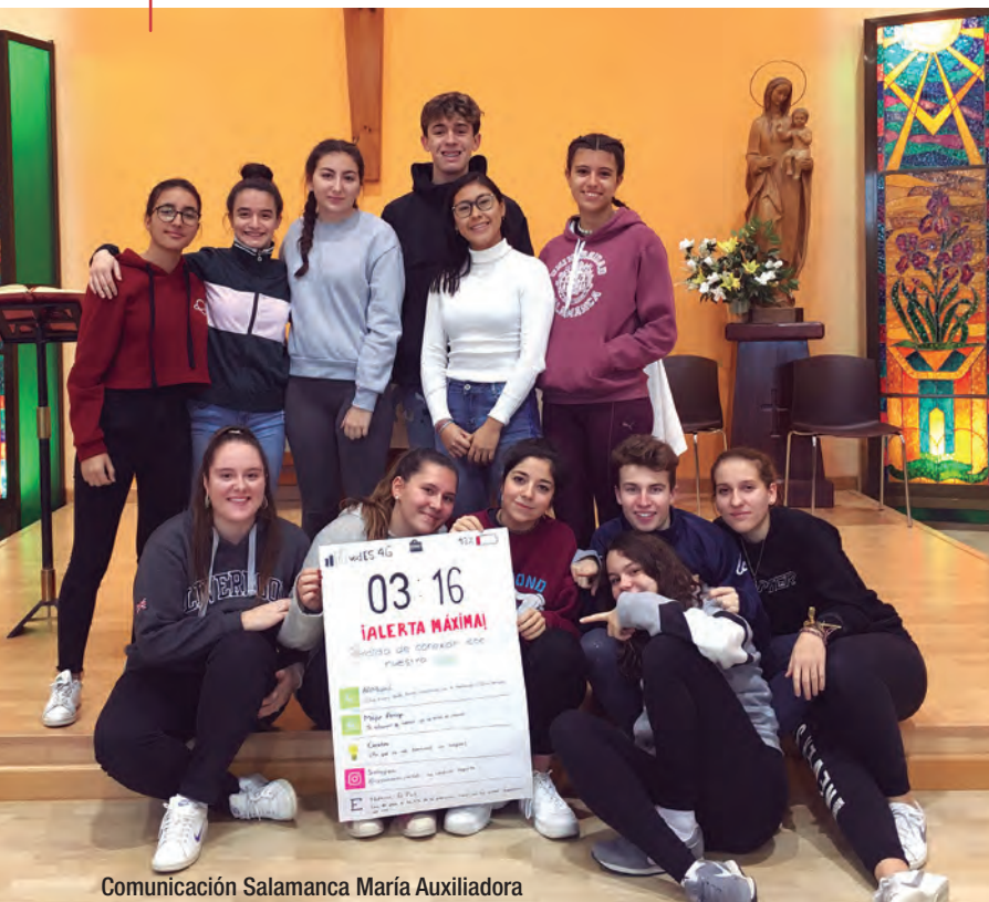
Comunicación Salamanca María Auxiliadora

Uno de los Comandos de la Misión “TeenExperience” de Salesianos María Auxiliadora de Salamanca presentando su proyecto en la capilla de la casa de Almenara de Tormes, donde vivieron la experiencia el pasado mes de diciembre.