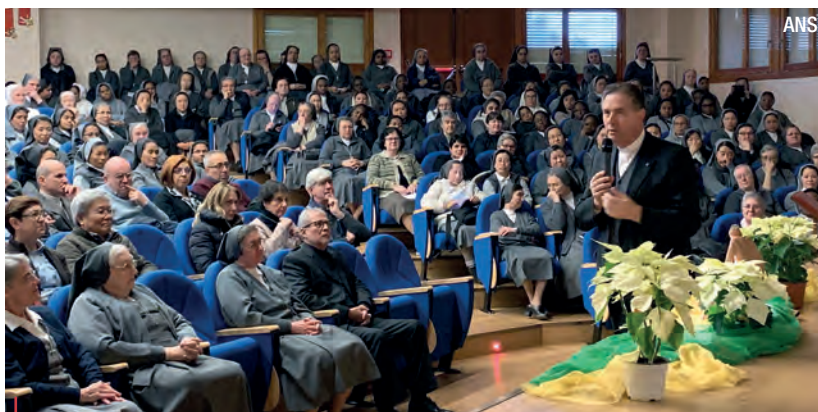
El Rector Mayor dirigiéndose a los presentes en la presentación del Aguinaldo 2020.

El Rector Mayor, en su presentación comienza recordando las expresiones que utilizaba Don Bosco cuando animaba a los jóvenes a cumplir este binomio educativo. Lo que nos hace comprender que Don Bosco no es un teórico, sino que es un hombre de acción, que reflexiona sobre el significado de sus iniciativas. Posteriormente, profundiza, en los numerosos ámbitos en los que ser buenos cristianos : buenos cristianos en la vida cotidiana iluminados por la fe, en un atento discernimiento, en el celo