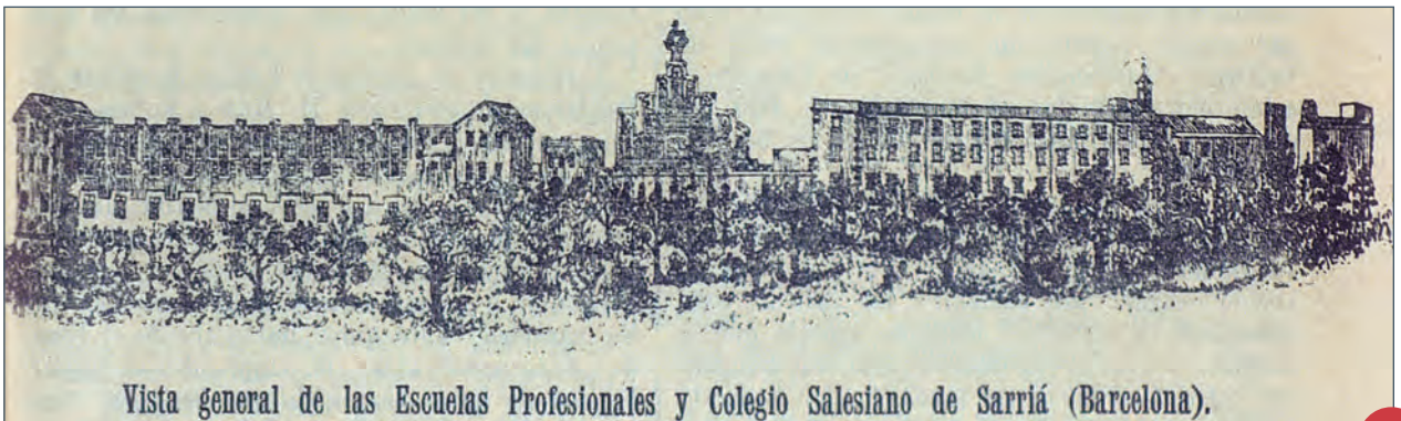
Vista general de las Escuelas Profesionales y Colegio Salesiano de Sarrià (Barcelona).

Puedes consultar el blog personal sobre la historia del Boletín Salesiano : https://boletinsalesianos.blogspot.com/