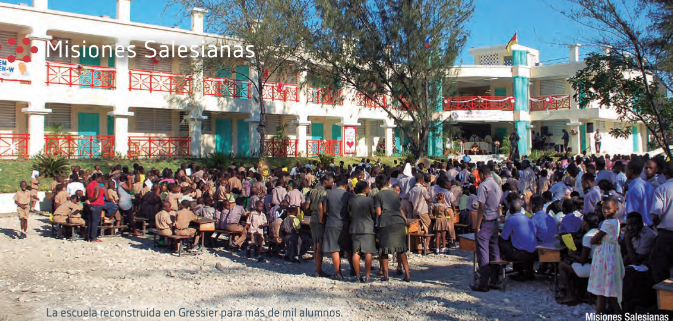
La escuela reconstruida en Gressier para más de mil alumnos.