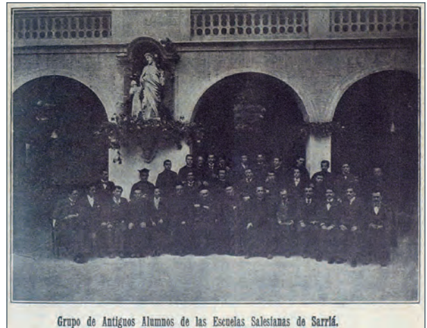
Grupo de Antiguos Alumnos de las Escuelas Salesianas de Sarrià.