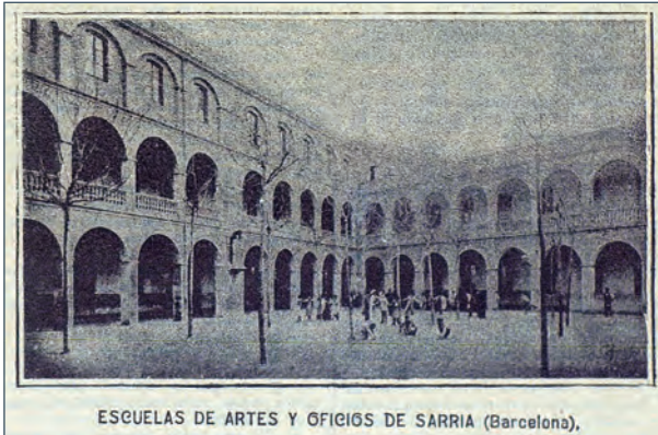
ESCUELAS DE ARTES Y OFICIOS DE SARRIÀ (Barcelona).