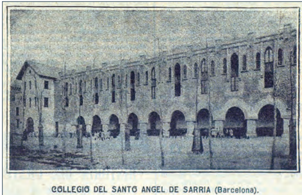
COLLEGIÓ DEL SANTO ÀNGEL DE SARRIÀ (Barcelona).