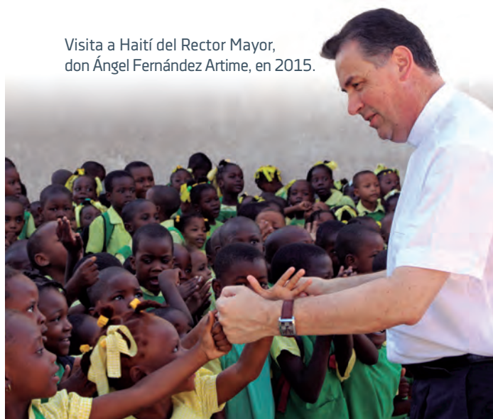
Visita a Haití del Rector Mayor, don Ángel Fernández Artime, en 2015.